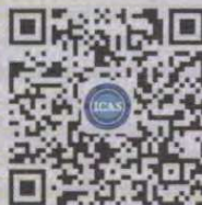
Focus on icas WeChat platform

Certification and Accreditation Administration of PRC: CNCA-R-2003-117 Tel: 400-633-9001 / +86 021-51114700 Web: www.icasiso.com Add: Room 801, HuaDing Mansion, 2368# West Zhongshan Rd., Xuhui District, Shanghai, China, 200235